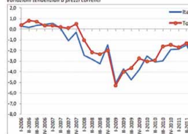
GRAFICO 1 Andamento delle VENDITE rispetto allo stesso trimestre dell'anno precedente Variazioni tendenziali a prezzi correnti